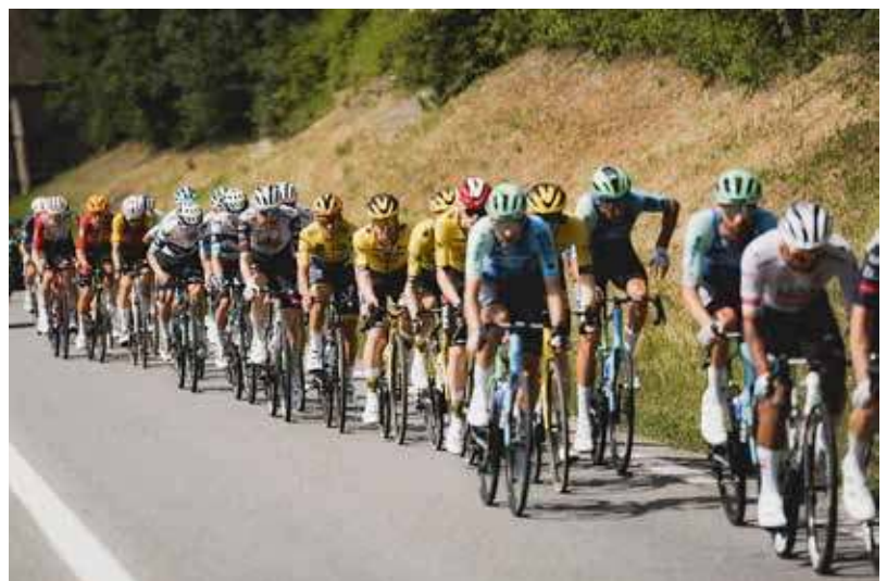
critérium 2025